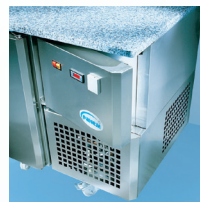
Accessibilité technique Technical easy reach