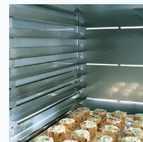
Intérieur Inox Stainless steel inside