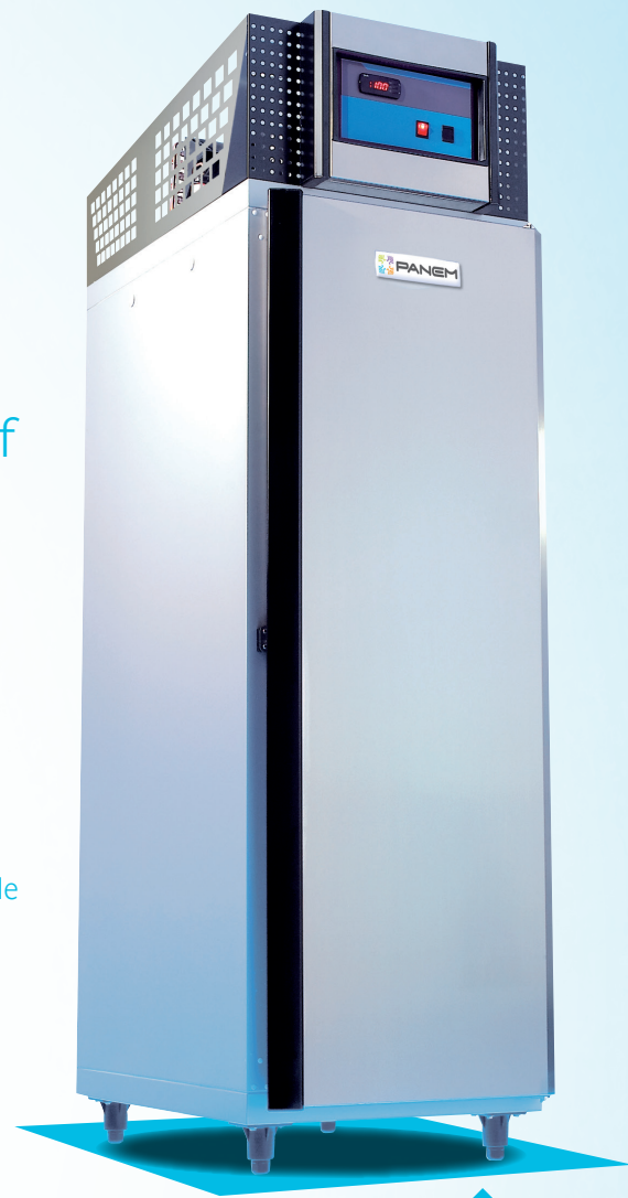
Froid ventilé / Ventilated cooled air option : chocolat Double-service / For chocolate storage Pass-through